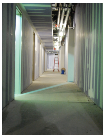
ARDEX Choice Contractor SMC E.F. Marburger - Fishers, IN