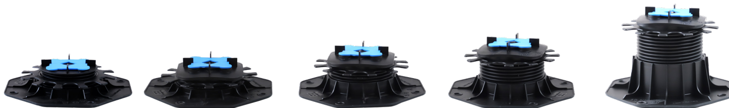
TSL-XS 26/36 mm