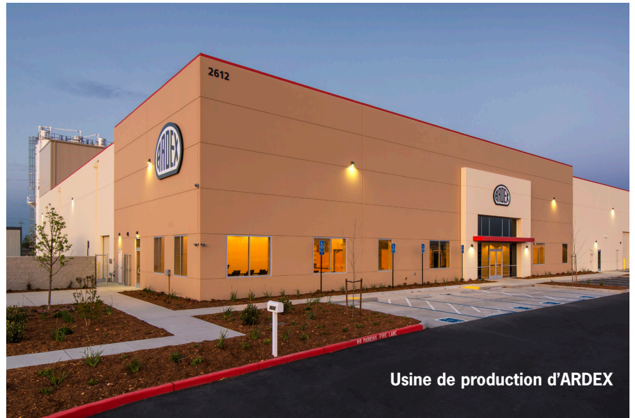
Usine de production d'ARDEX